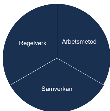
Figur 1 Tre delar i Snabbare lagföring