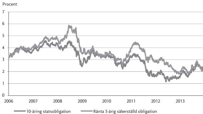
Diagram 1 Ränteutveckling 2006–2013