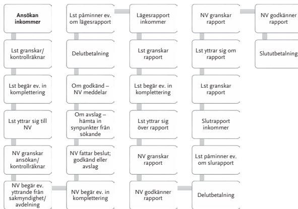
Figur 1 Klimatklivets arbetsprocess

Anm.: NV=Naturvårdsverket, Lst=Länsstyrelsen.