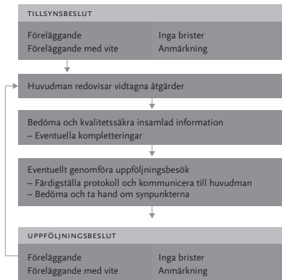
Figur 2 Process för uppföljning av tillsynsbeslut om föreläggande med eller utan vite