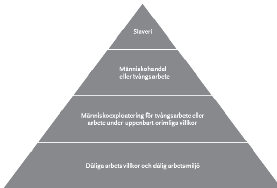
Figur 2 Olika grader av arbetskraftsexploatering

Arbetskraftsexploatering är ett samlingsbegrepp som beskriver att en individ utnyttjas av en arbetsgivare och drabbas av olika typer av missförhållanden på arbetsplatsen. 20 Enstaka eller mindre missförhållanden på arbetsplatsen klassas inte som arbetskraftsexploatering, utan bristerna behöver vara omfattande. I de allra allvarligaste fallen kan arbetskraftsexploatering innefatta allvarligt utnyttjande eller tvång och betraktas som människohandel för tvångsarbete, tvångsarbete eller till och med slaveri. I triangeln nedan visas en gradering av allvarlighetsgraden av exploatering och utnyttjande av arbetstagare. 21