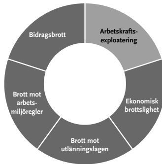
Figur 1 Arbetskraftsexploatering som en del av arbetslivskriminaliteten

En och samma arbetsgivare kan exempelvis ägna sig åt både ekonomisk brottslighet, så som till exempel skattefusk, ha arbetskraft utan arbetstillstånd – och därmed bryta mot utlänningslagen – samt exploatera arbetskraft. En bidragande orsak till att det finns arbetskraftsexploatering och andra typer av kriminalitet i arbetslivet är att det finns en marknad för billiga tjänster. Det förekommer initiativ för att öka medvetenheten och kunskapen om vad man ska