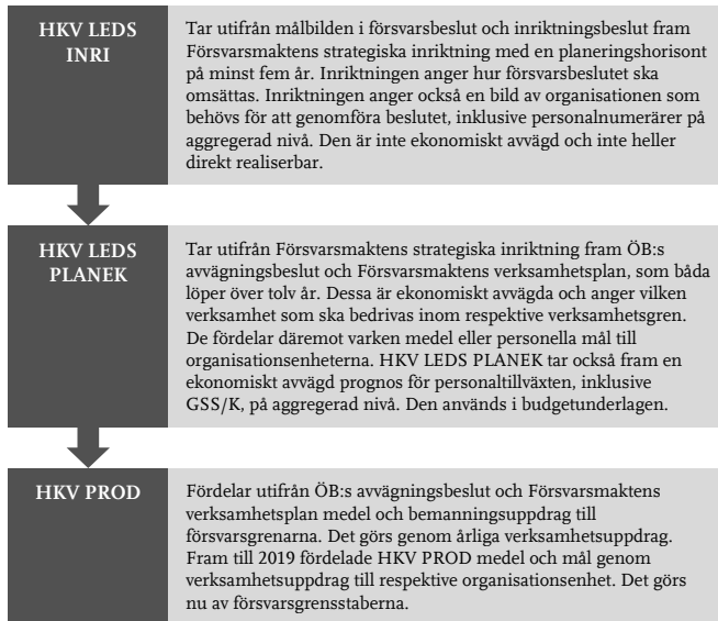
Figur 2 Försvarsmaktens planeringsprocess och interna styrning