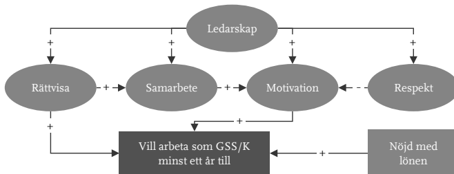
Figur 3 Modell över viljan att arbeta som GSS/K minst ett år till

Svarsfrekvensen på enkäten var 35 %. När enkäten skickades ut fanns 4 692 anställda GSS/K. Av dessa valde 1 640 GSS/K att svara. Bortfallet blev därför 65 %. Det finns också ett mindre bortfall på enskilda frågor. Antalet svarande som fyllt i alla enkätfrågor som används i modellen var 1 072. Partiellt bortfall var därför 35 %.