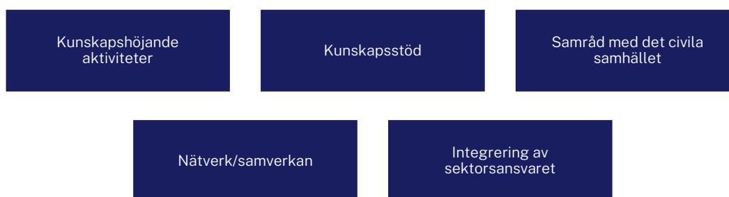
Figur 3 Samlande, stödjande och pådrivande aktiviteter inom ramen för sektorsansvaret

Nedan följer exempel på olika aktiviteter som de sektorsansvariga myndigheterna genomfört inom sektorsansvaret. Uppräkningen är inte uttömmande eftersom flera myndigheter bedrivit en mängd olika aktiviteter. Samtidigt är variationerna stora och granskningen visar att vissa av myndigheterna har genomfört ett mycket begränsat antal aktiviteter som går att koppla till sektorsansvaret. För att åskådliggöra vilka olika typer av samlande, stödjande och pådrivande åtgärder de olika myndigheterna initierat har vi kategoriserat aktiviteterna.